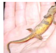
Unterseite eines Männchens

Weibchen kleinere und hellere flecken auf der Oberseite als das Männchen gelbe Ballenflecken auf der Fußsohle (NICHT beim Teichmolch-Weibchen!)