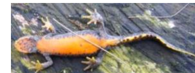
Unterseite eines Weibchens