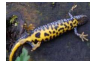
Unterseite vom Weibchen

Bergmolch Bauch ungefleckt Länge: 9 - 12 cm Flanke: schwarz-weiß punktiert, Blauer Streifen zwischen Flanke und Bauch