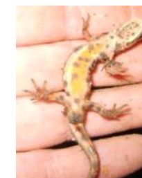
Unterseite vom Männchen

Weibchen feine Tupfen heller gefärbte Kloake als Männchen